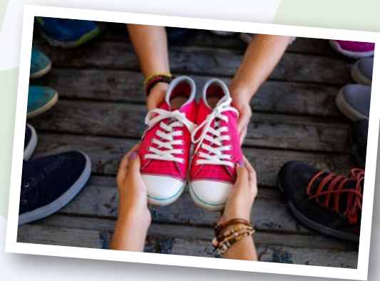
Alte Schuhe, neuer Spaß – Secondhand rettet dein Taschengeld!

Zudem kannst du so richtig coole Sachen tragen, die nicht jeder hat. Für deinen eigenen besonderen Style!