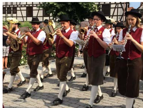
Die Trachtenkapelle Ziersdorf, Partnergemeinde von Kürnbach, spielt beim Weindorf.

Kürnbach, gelegen an der Grenze zum Enzkreis und zum Landkreis Heilbronn, hat eine einzigartige historische Besonderheit: Es war von 1598 bis 1904 ein sogenanntes Kondominat . Das bedeutet, dass es von zwei verschiedenen Herrschaftsgebieten gleichzeitig regiert wurde, nämlich zunächst von Württemberg und der Kurpfalz und später von Baden und der Kurpfalz. Die Grenze zwischen den beiden Territorien verlief mitten durch das Dorf, was zu