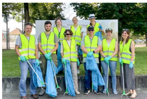
Der Abfallwirtschaftsbetrieb wurde mit einer Müllsammelaktion aktiv.

seinen Abfall deshalb mit nach Hause und entsorgt ihn in der vorgesehenen Mülltonne. ■