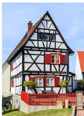
Heimathaus in Eggenstein – ein Fenster in die Vergangenheit.

Auch die Kultur kommt nicht zu kurz: Das Heimatmuseum in Eggenstein und das Heimatmuseum in Leopoldshafen geben interessante Einblicke in die lokale Geschichte und das Leben vergangener Zeiten. Mit vielen Veranstaltungen, rund 70 Sport- und Kulturvereinen sowie einem aktiven Seniorenbeirat, der Projekte wie Messen und Mitmach-Programme organisiert,