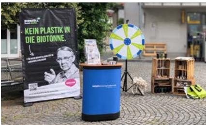
Infostand in Stutensee.